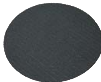
Gummiauflage für Bierglasträger und Tablettts