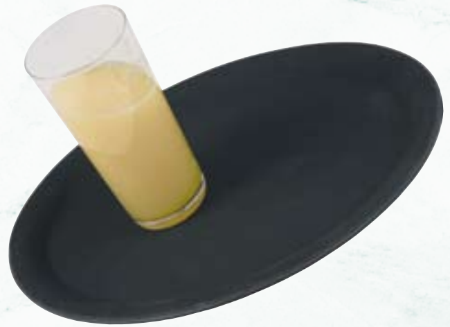
PP Café-Tablett rutschfeste Oberfläche, stabile Ausführung