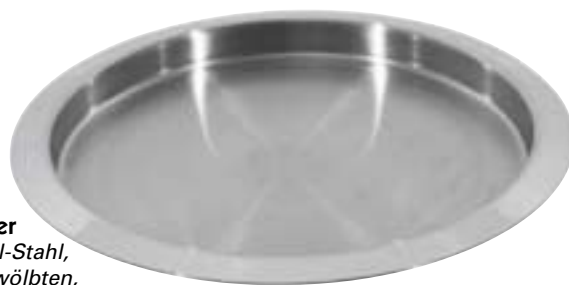
Bierglasträger Chrom-Nickel-Stahl, mit leicht gewölbten, hochglanzpoliertem Rand