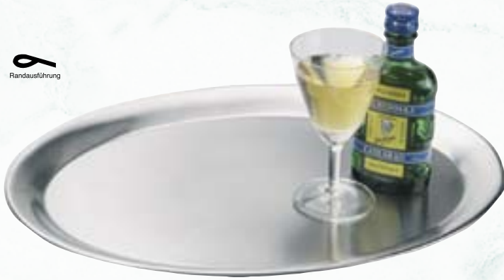
Serviertablett Chrom-Nickel-Stahl Rand geschlossen