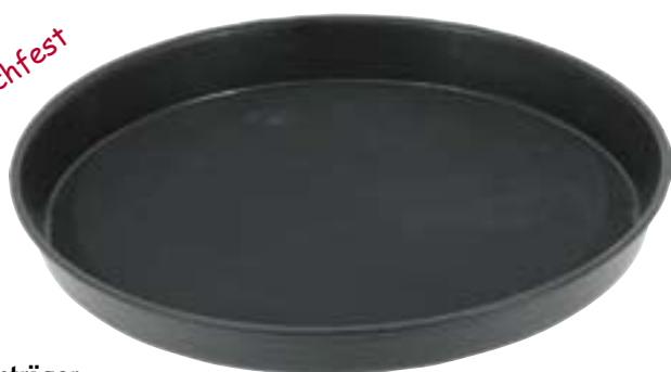
Bierglasträger rutschfest PP, mit hohem Rand