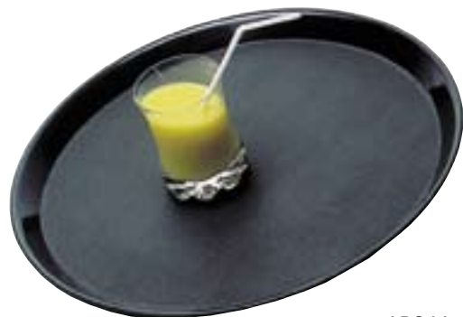
Bierglasträger rutschfest ABS bis 70° C hitzebeständig