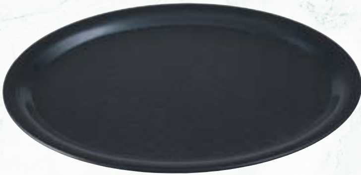
PP Café-Tablett rutschhemmende Oberfläche, für Geschirrspüler geeignet