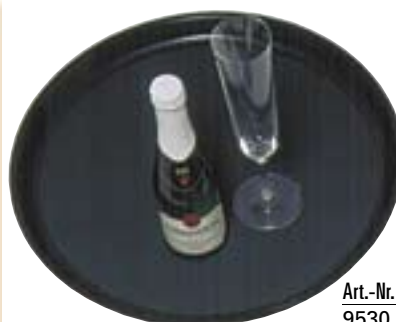
Polyester-Bierglasträger rutschfest, flacher Rand